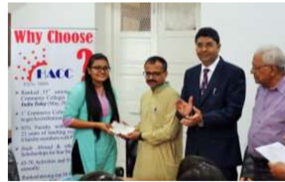
HACC college distributed scholarship cheques