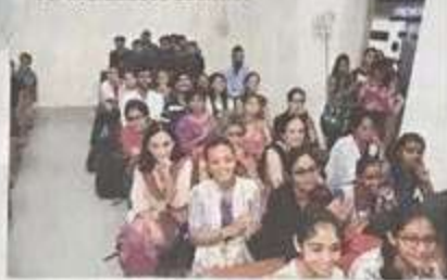
An enthusiastic audience