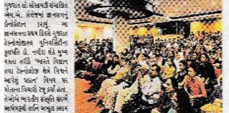
આ કાર્યક્રમમાં કોલેજના ડાક્ટરો વધારે વિદ્યાર્થીઓને જ્ઞાન લીધો હતો.