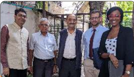
NJCU Dean and VP visit HACC