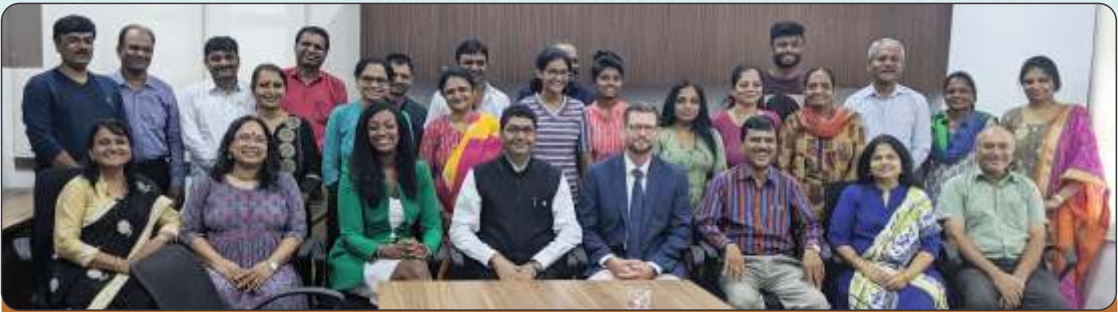
NJCU Dean and VP visit HACC