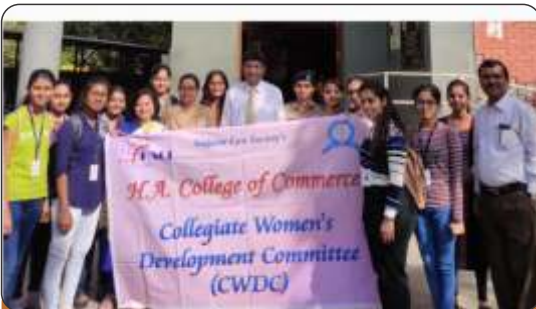
CWDC Visit to the Women-run police station