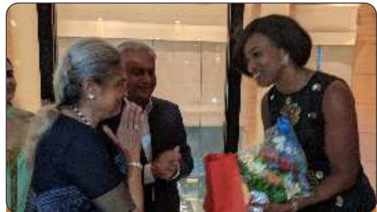
NJCU Dean and VP visit HACC