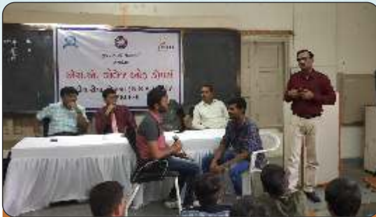
Anti Drug Addiction Day