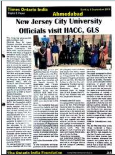
Niswarth Cheque Distribution