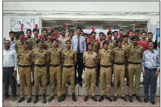
HACC NCC Unit