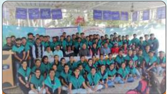
NSS Camp at Ropda Village