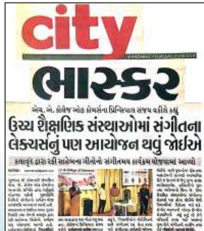
Mohammad Rafi Musical Programme