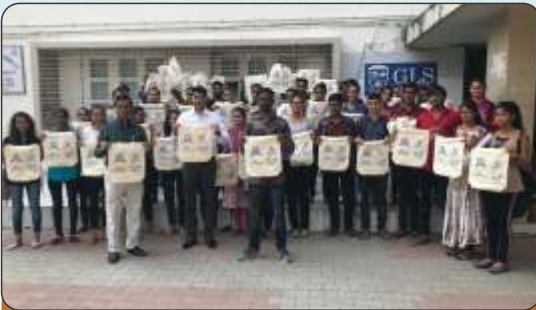
Stop Plastic Bags Campaign