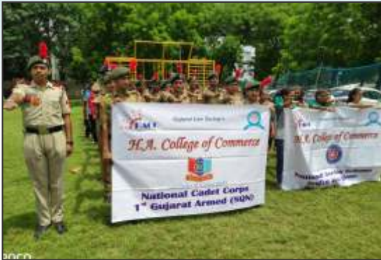
Fit India Day