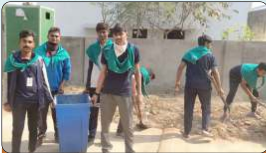
NSS Camp at Ropda Village