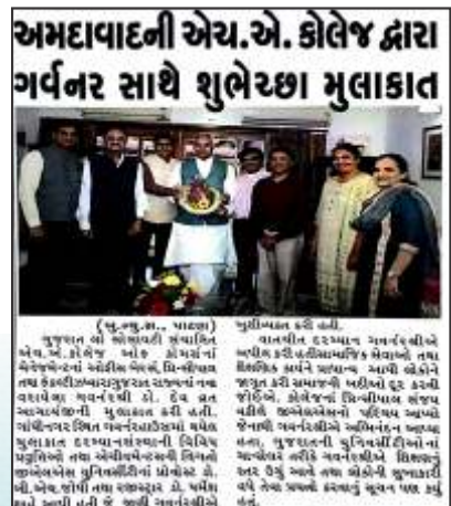
Visit to Raj Bhavan