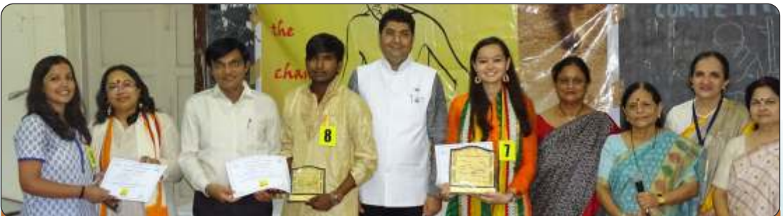
Talk on Gandhiji