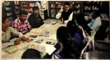
Book Reading Workshop