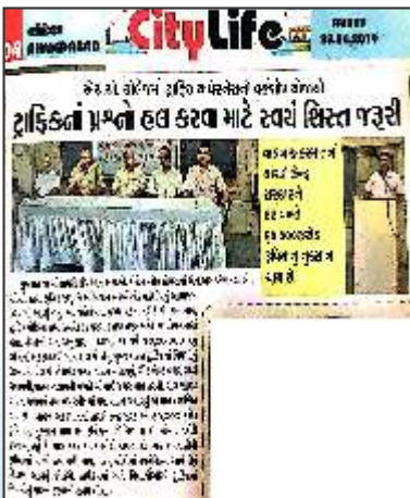
Traffic Awareness Programme