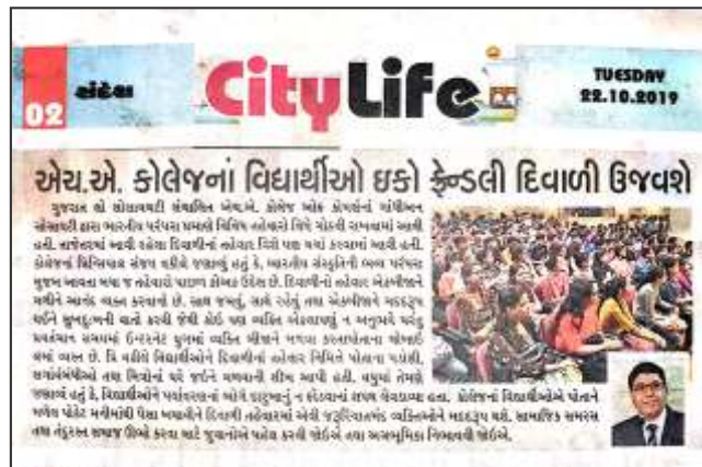
Eco Friendly Diwali Awareness Programme