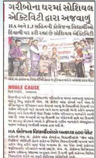
Joy of Giving