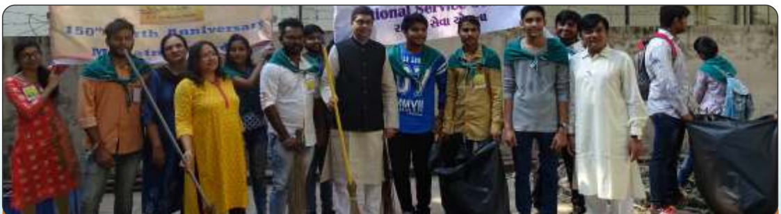
Gandhi Jayanti Swachhata Abhiyaan