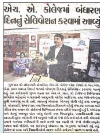
Indian Constitution Day Celebration