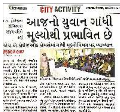
150 Gandhi Anniversary