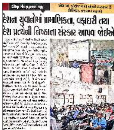
Anti Corruption Day Celebration