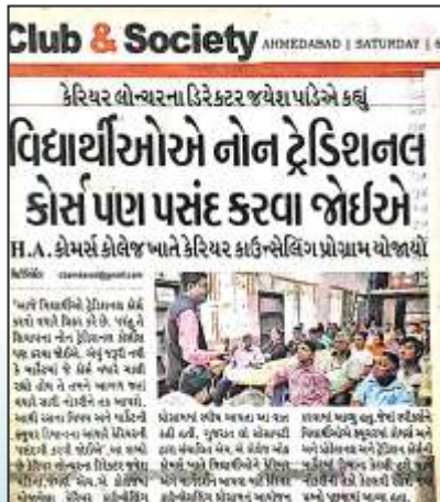
Career Counselling Programme