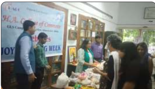
Joy of Giving