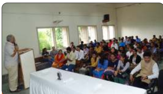
Talk on Gandhi