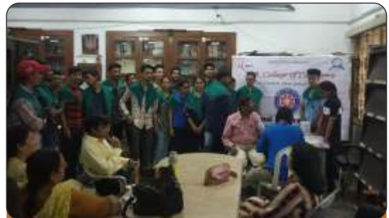
Free Health Check-up