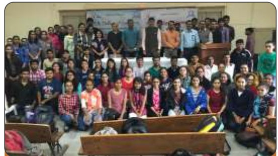
Matdar Jagruti Abhiyaan