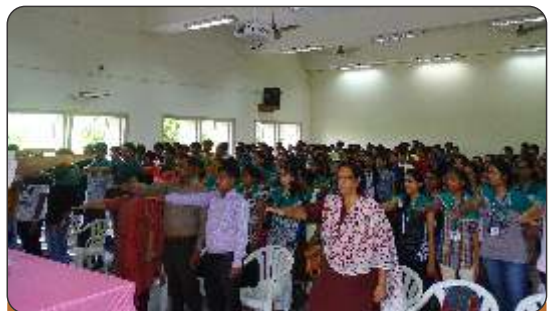
Free Health Check-up