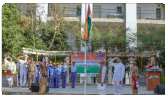
Republic Day Celebration