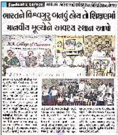
Sathya Sai Elocution competition