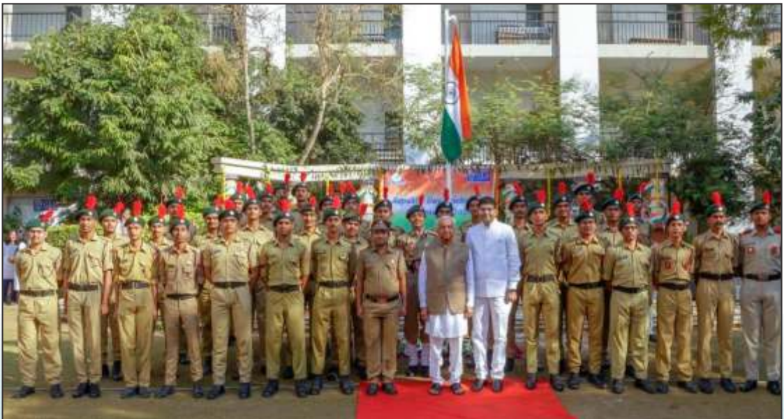
Republic Day Celebration