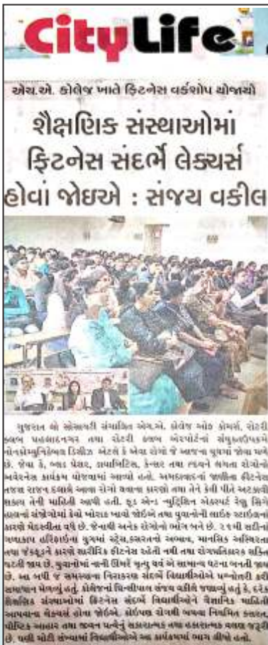
Non Communicable Disease