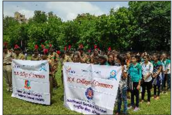
Fit India Day