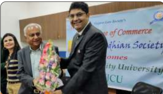
NJCU, USA, visits HACC and GLS