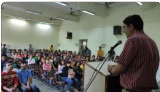
NSS Orientation Programme