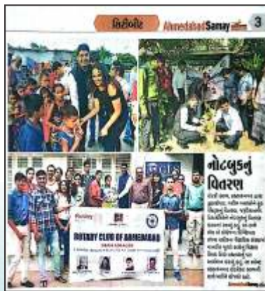
Notebook Distribution Programme