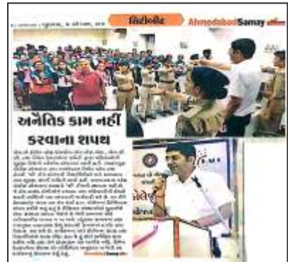
Self Defence Progmm