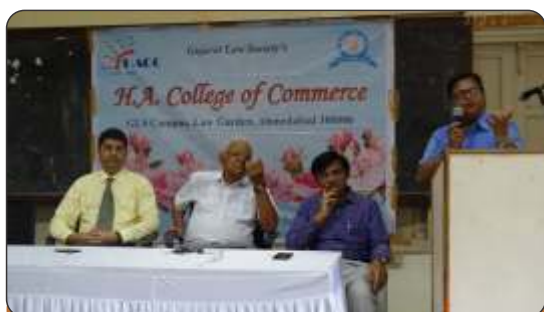
Personality Development Talk