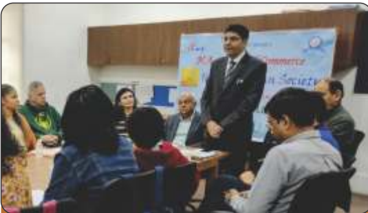
NJCU, USA, visits HACC and GLS