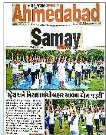
International Yoga Day Celebration