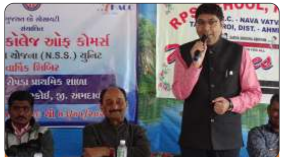
NSS Camp at Ropda Village