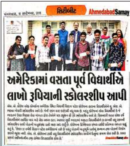
Niswarth Cheque Distribution