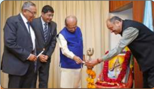
Inauguration of Gyansatra