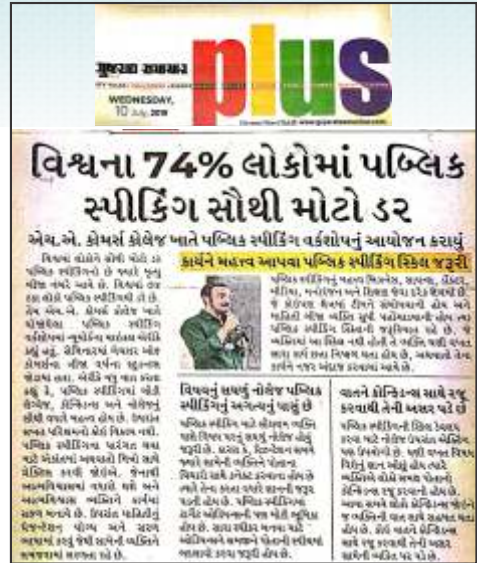
Public Speaking Seminar