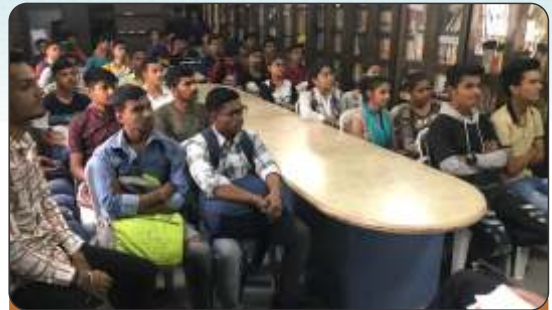
Ahmedabad Establishment Day