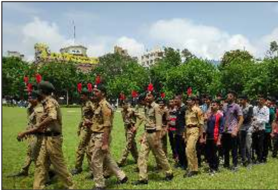
Fit India Day