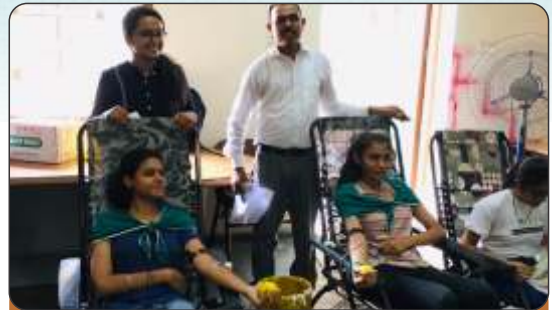
Blood Donation Camp