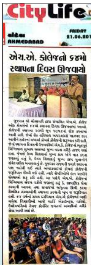
64th establishment day of HACC