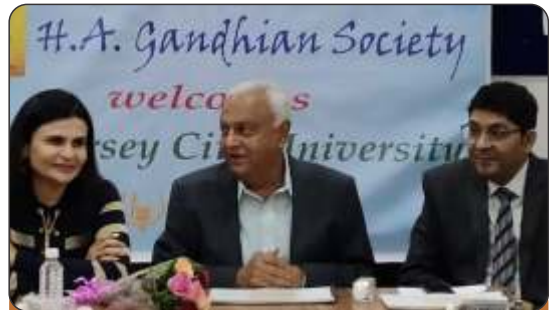
NJCU, USA, visits HACC and GLS