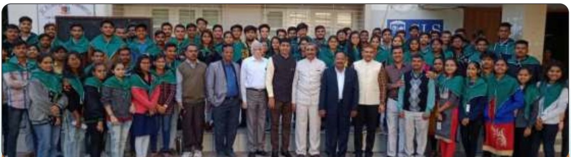
Training the Youth