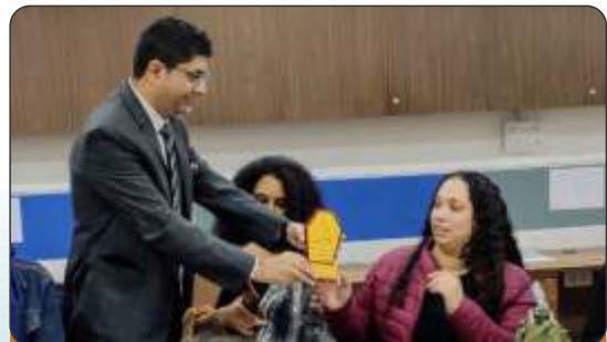
NJCU, USA, visits HACC and GLS