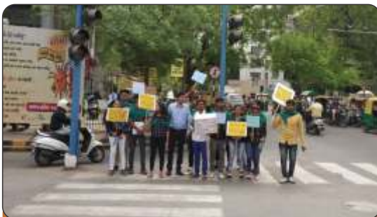
Traffic Awareness programme