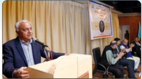
Inauguration of Gyansatra