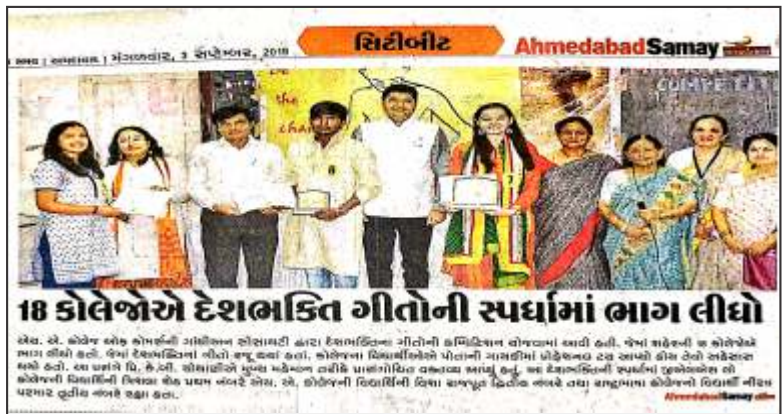
Patriotic Song Competition