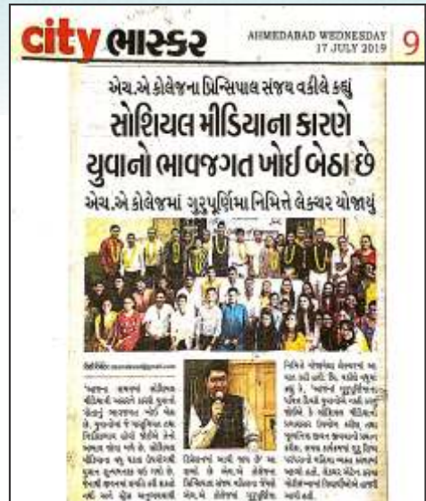
Guru Purnima Day Celebration