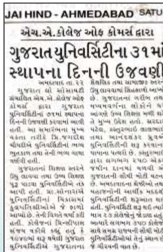
Gujarat University establishment day