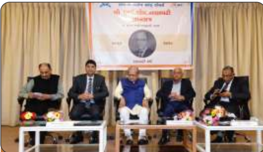
Inauguration of Gyansatra