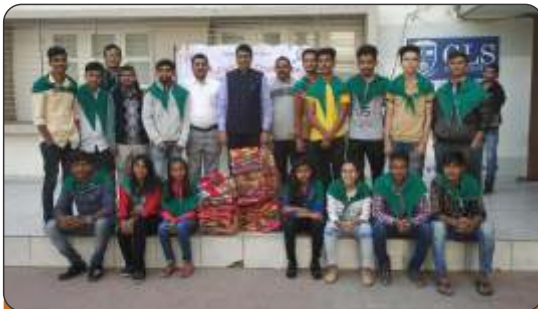
Donation of Blankets