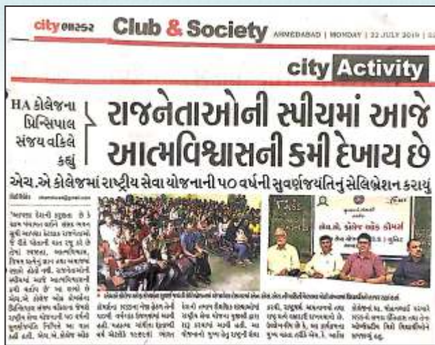
Inauguration of Gyansatra