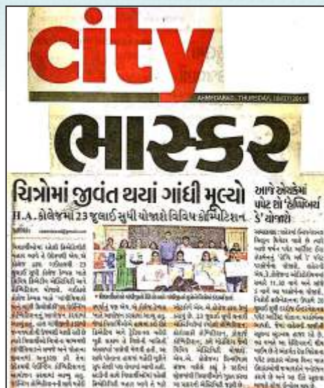
Cultural Activities at HACC